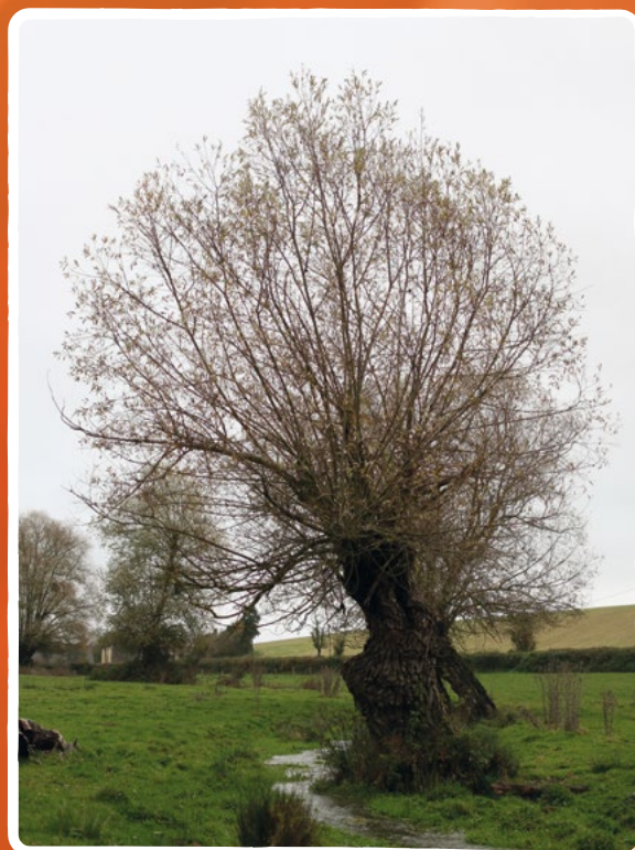
Saule têtard entretenu

Dans le cas où la végétation est soumise à une pression animale (abrouissement par les bovins par exemple), cette pratique est intéressante puisque les rejets ne sont plus accessibles par les animaux. Ce traitement est donc particulièrement adapté sur des arbres isolés dans les pâtures.