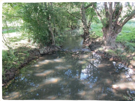
Vieux têtard non entretenu

Si un têtard n'a pas été entretenu depuis plus de 20 ans, il faut éviter de couper tous les rejets d'un coup ; l'arbre s'en trouvera alors très affaibli. Il est conseillé dans ce cas de couper uniquement les plus gros rejets et les rejets latéraux puis d'effectuer une deuxième coupe 5 ans plus tard.